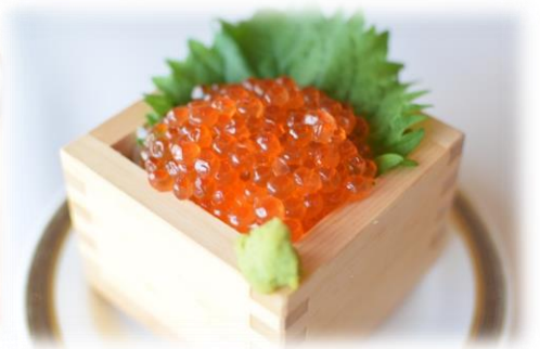
一合升いくらごはん